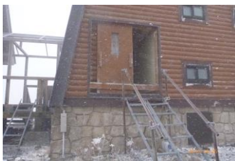
岩手山八合目避難小屋裏の出入り口

別棟の水洗トイレは凍結防止のため、来年の六月頃まで使用できませんので、小屋の中のトイレを利用して下さい。(登山靴は脱いで使用願います)