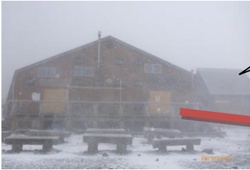
岩手山八合目避難小屋正面

平成27年10月24日(土)～25日(日)にて岩手県山岳協会加盟団体の協力により、岩手山八合目避難小屋を夏季小屋から冬期小屋に切りかえました。